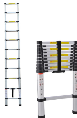
OBR. TELESKOPICKÝ ŽEBŘÍK